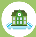
Numero studenti per indirizzo di studio e anno di corso