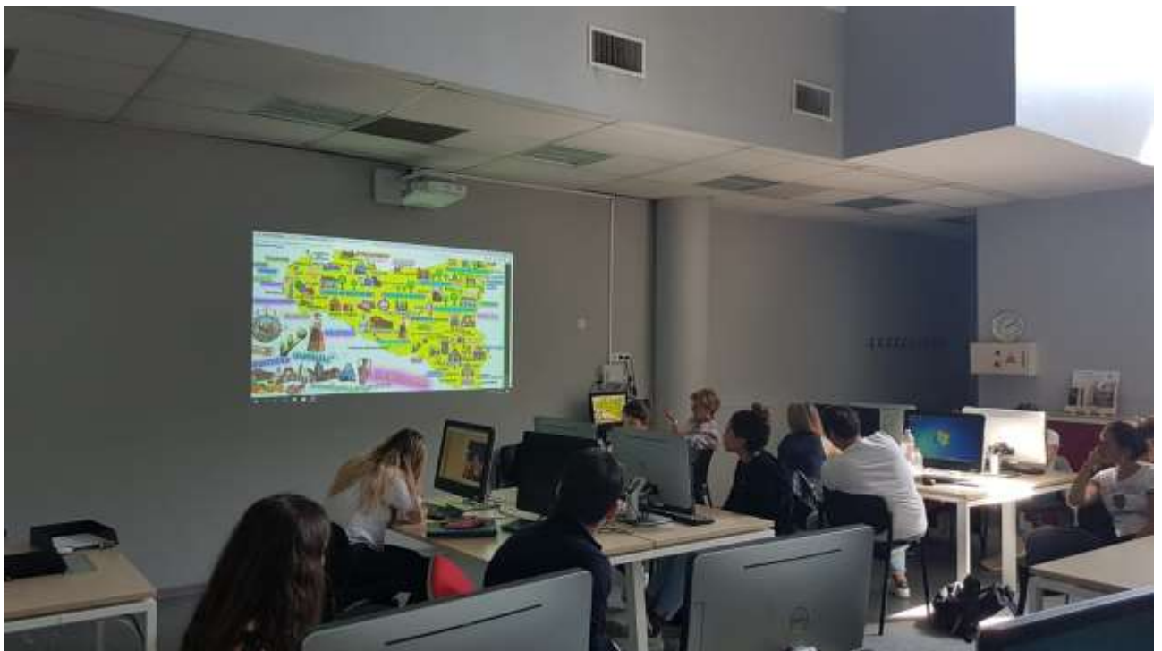
Dans les classes