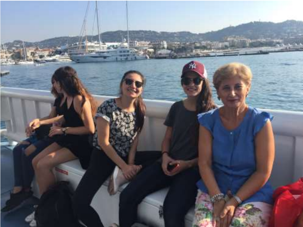
Quelques moments de détente avec les élèves